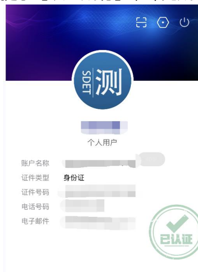
“用户认证信息” 页面